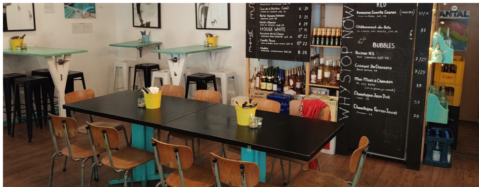
Allan's Breakfast Club